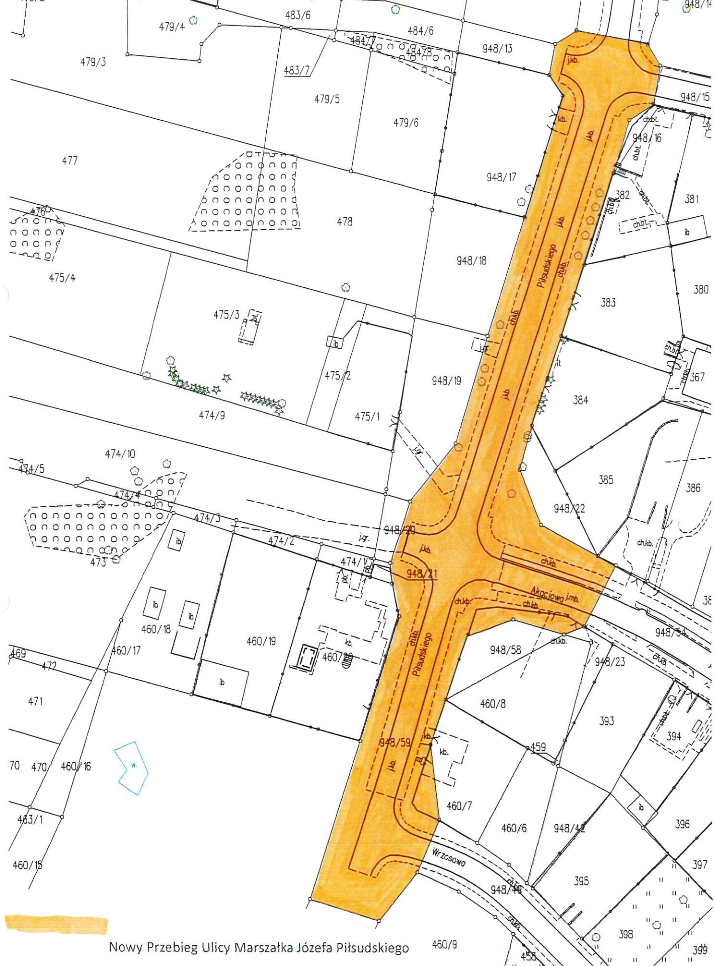
Nowy Przebieg Ulicy Marszałka Józefa Piłsudskiego