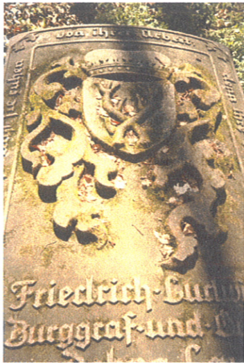
Płyta nagrobna rodziny Dohnów w Markowie