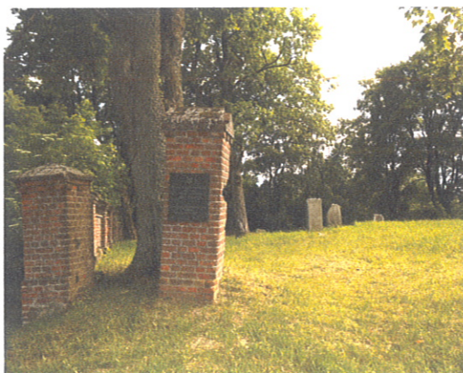
Kirkut - Cmentarz Żydowski w Morągu