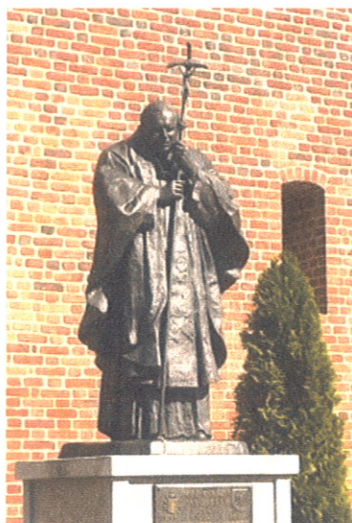
Pomnik Jana Pawła II przy ratuszu