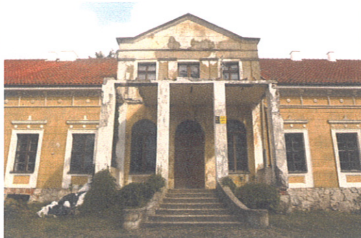
Pałac w Bożęcinie