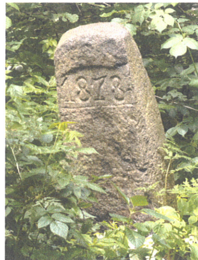
Granitowa stela w parku „Kminikowa Góra”