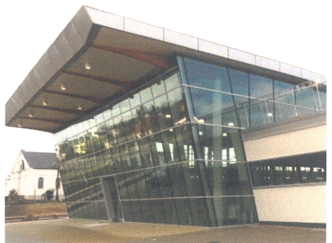
Pływalnia „Morąska Perła”