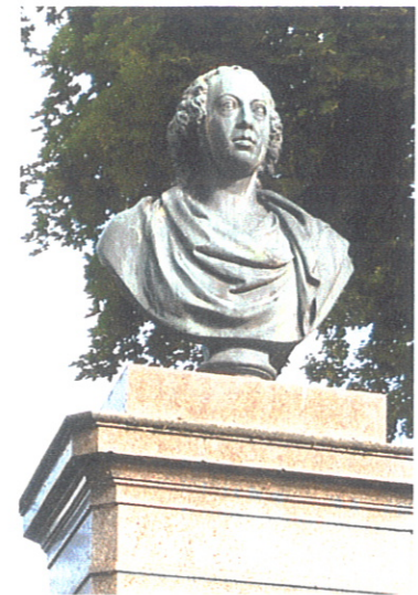
Pomnik J. G. Herdera