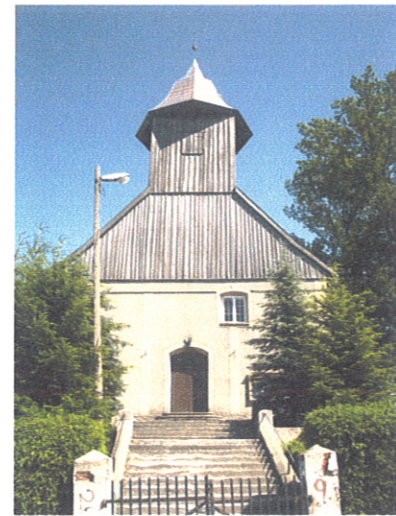
Zabytkowy kościół w Chojniku