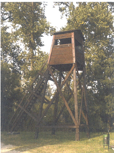
Wieża widokowa nad Rozlewiskiem Morąskim