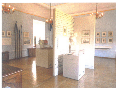
Muzeum J. G. Herdera w Morągu