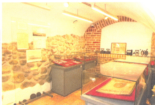
Morąska Izba Pamięci Historycznej w ratuszowych piwnicach