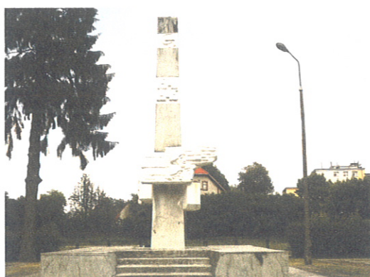
Pomnik Żołnierzy Armii Radzieckiej