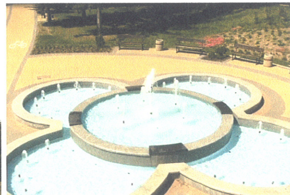
Fontanna w Parku Miejskim w Morągu