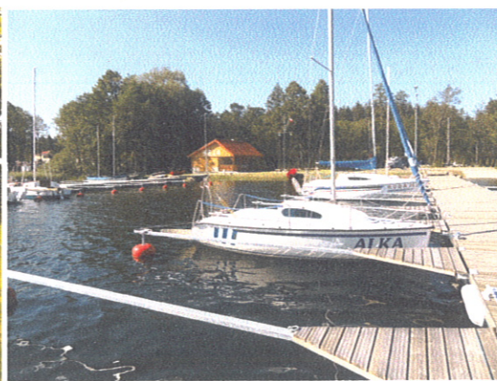
Przystań Żeglarska „KEJA” w Bogaczewie