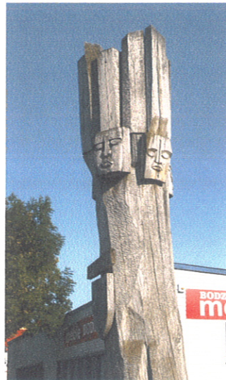
Drewniany pomnik Światowida