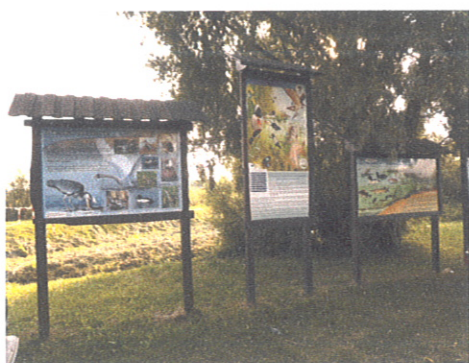
Tablice Informacyjne nad Rozlewiskiem Morąskim