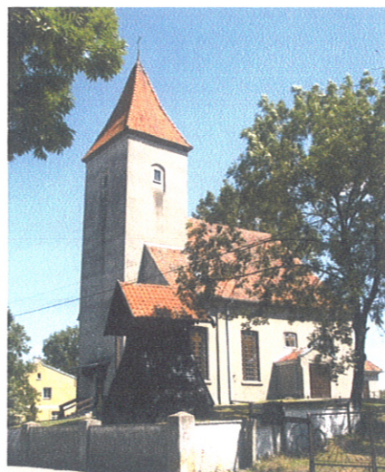
Zabytkowy kościół w Słoneczniku