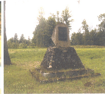
Pomnik Poległych Mieszkańców podczas I Wojny Światowej w Niebrydowie Wielkim