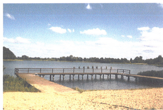
Plaża nad jeziorem Skiertąg