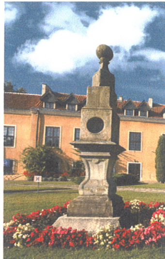
Zegar Słoneczny przed Pałacem Dohnów