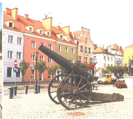
Armata stojąca przed ratuszem